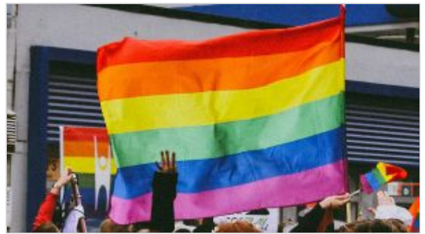
Esto piensa un transexual antes de la cirugía de cambio de sexo