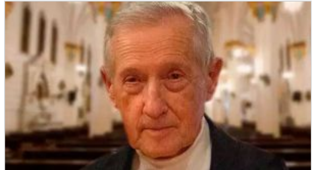
Sacerdote anciano fallece en accidente de tránsito

“Repudiamos categóricamente este hecho que ofende el sentimiento