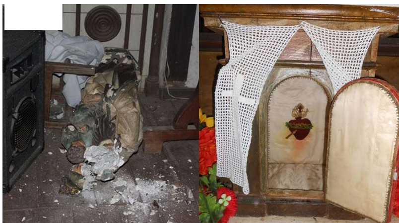
Ataque a Capilla María Auxiliadora